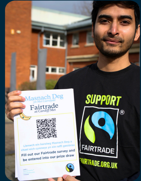
Ymgysylltu staff a myfyrwyr yn yr Arolwg Ymwybyddiaeth Masnach Deg blynyddol.

Gyda'i gilydd, mae'r camau hyn wedi helpu i sicrhau bod Masnach Deg wedi parhau i fod yn weladwy, yn hygyrch ac yn ystyrlon ar draws y campws.