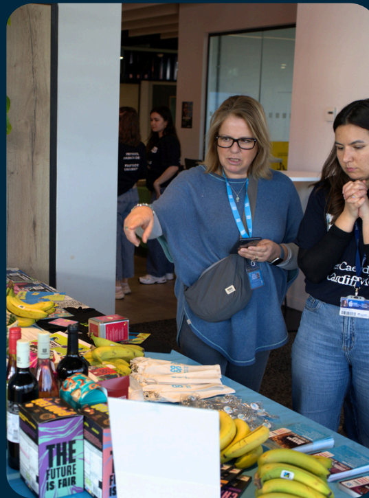
Cydweithio â grwpiau Masnach Deg lleol yn y gymuned.