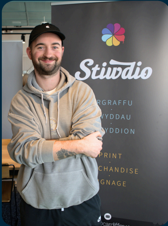
Mwy o hyrwyddo ein cynnyrch cotwm Masnach Deg mewn dillad a nwyddau.